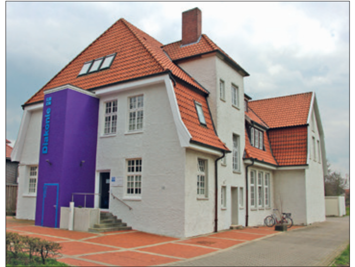
Das Diakonische Werk in Diepholz

Neben Ratsuchenden mit sozialrechtlichen Fragen kommen aber auch Menschen ins Diakonische Werk, um psychosoziale Beratung und Hilfen in Anspruch zu nehmen. Die Anliegen sind sehr unterschiedlich. Es geht zum Beispiel um die Verarbeitung von Trauer und Traumata, um schwierige Arbeitsbedingungen, Erziehungsschwierigkeiten, familiäre Probleme oder um die Überbrückung von Wartezeiten für Psychotherapien. Die Zunahme der psychischen Erkrankungen in der Bevölkerung spiegelt sich auch in den Beratungen der Kirchenkreissozialarbeit vor Ort wider. Die Fachstellen der Diakonie zeigen Wege auf, vermitteln Hilfe, Kontakte und Angebote.