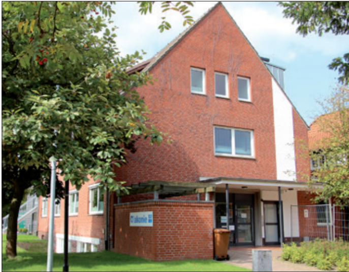
Das Diakonische Werk in Syke

Neben Ratsuchenden mit sozialrechtlichen Fragen kommen aber auch Menschen ins Diakonische Werk, um psychosoziale Beratung und Hilfen in Anspruch zu nehmen. Die Anliegen sind sehr unterschiedlich. Es geht zum Beispiel um die Verarbeitung von Trauer und Traumata, um schwierige Arbeitsbedingungen, Erziehungsschwierigkeiten, familiäre Probleme oder um die Überbrückung von Wartezeiten für Psychotherapien. Die Zunahme der psychischen Erkrankungen in der Bevölkerung spiegelt sich auch in den Beratungen der Kirchenkreissozialarbeit vor Ort wider. Die Fachstellen der Diakonie zeigen Wege auf, vermitteln Hilfe, Kontakte und Angebote.