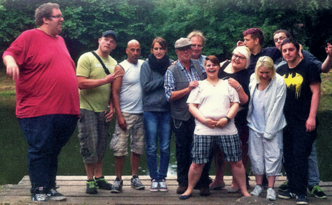
Zusammen die Zukunft angehen: Die Teilnehmer der „Aktivcenters“.

Dipl. Sozialarbeiter im Diakonischen Werk Diepholz